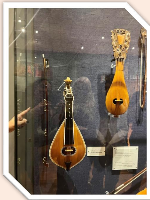
Η λύρα του Νίκου Ξυλούρη, δωρεά στο μουσείο από συγγενείς του.

Στα πλαίσια του εκπαιδευτικού προγράμματος οι μαθητές άκουσαν το παραδοσιακό Μικρασιάτικο τραγούδι «Θα σπάσω κούπες» καθώς και τη σύγχρονη διασκευή του από τη Μαρίνα Σάττι, ανακαλύπτοντας τη συνέχεια στη μουσική παράδοση. Έπειτα τραγούδησαν το τραγούδι και το συνόδευσαν παίζοντας μουσικά όργανα (τουμπελέκι, ντέφια, κουτάλια, νταούλι, μπαγλαμά).